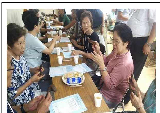
会場の様子(サイカチを手に語る)