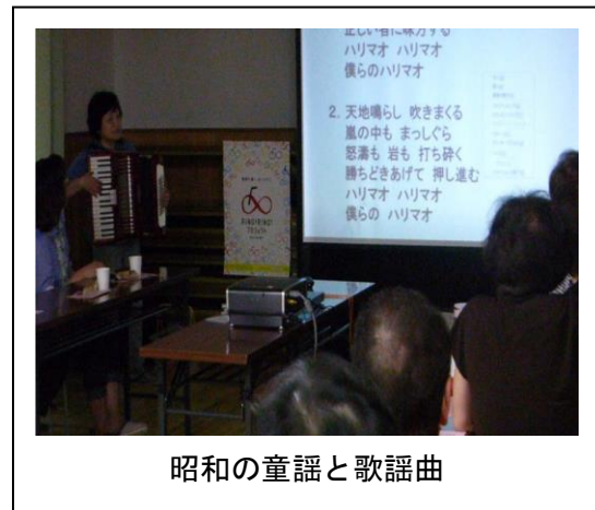
昭和の童謡と歌謡曲